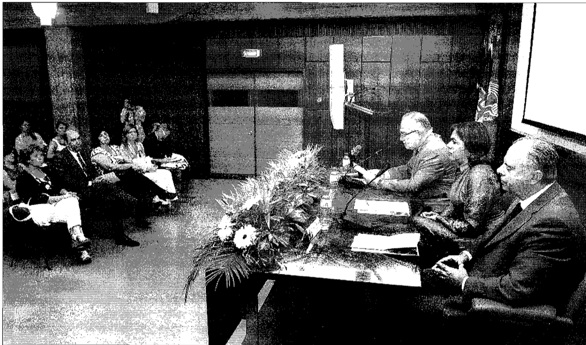
● Seminário "A Rota da Igualdade na Madeira" decorreu no auditório do Centro de Segurança Social.

Texto: Ricardo Caldeira