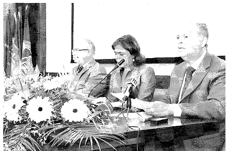
Governos querem mais cooperação.

A apresentadora diz que é preciso não esquecer a Madeira, enquanto não se voltar à normalidade e tudo estiver resolvido. "Fiquei impressionada com a vossa capacidade de reacção e a vossa capacidade de fazerem omeletes sem ovos", referiu a propósito do trabalho de reconstrução.