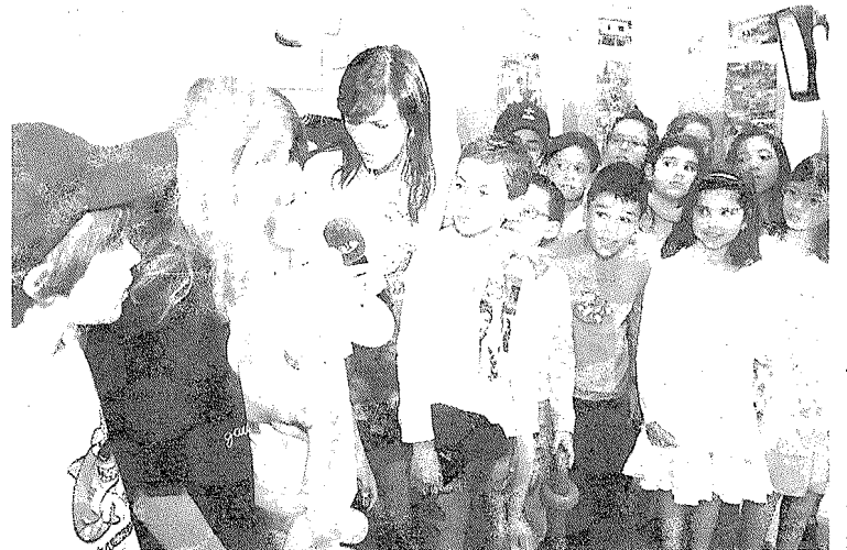
Figuras públicas devem ajudar, diz a apresentadora.

"Já pedimos à Direcção Regional do Ambiente uma inspecção ambiental, também para poder ir de encontro à resolução deste caso", alega, reconhecendo que a permanência do ferro velho naquele local, não só "prejudica a imagem do concelho" mas também mancha aquela que é "a porta de entrada na freguesia dos Canhas", concretiza.