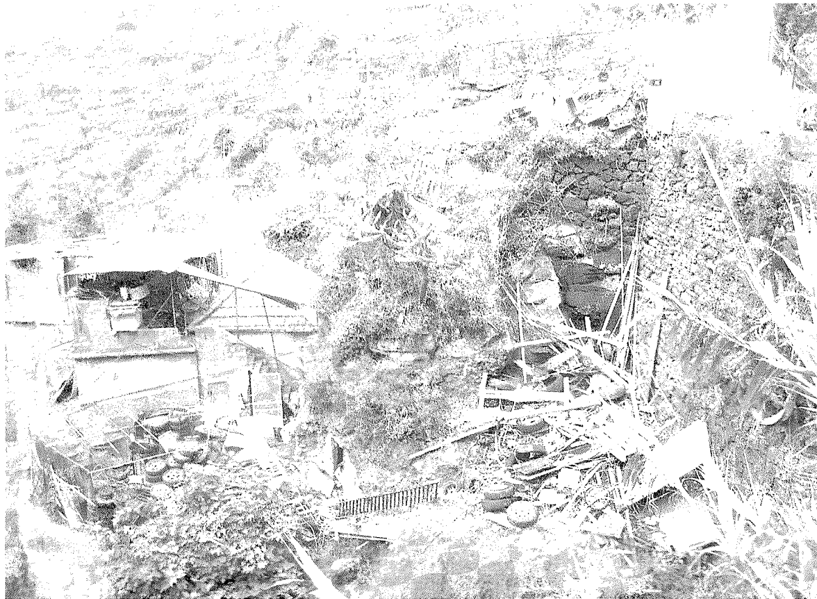
Os amontoados de ferro velho espalham-se não só em terrenos privados como também na via pública.