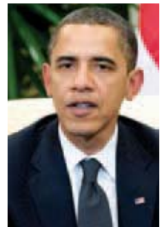
Presidente dos EUA está agora na China para visita

Périplo. Ontem, Obama chegou a Xangai, China, para a penúltima etapa de um périplo de uma semana pela Ásia Oriental, que terminará na Coreia do Sul.